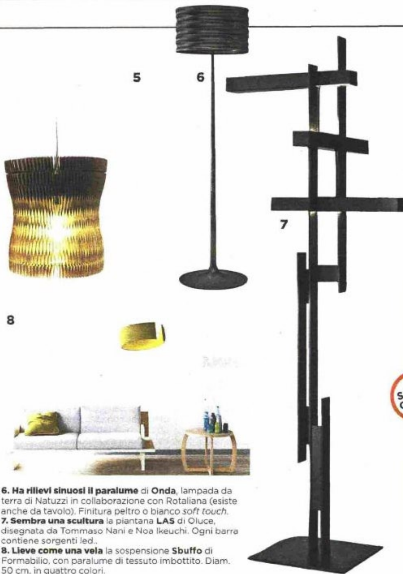
6. Ha rilievi sinuosi il paralume di Onda , lampada da terra di Natuzzi in collaborazione con Rotaliana (esiste anche da tavolo). Finitura peltro o bianco soft touch . 7. Sembra una scultura la piantana LAS di Oluce, disegnata da Tommaso Nani e Noa Ikeuchi. Ogni barra contiene sorgenti led. 8. Lieve come una vela la sospensione Sbuffo di Formabilio, con paralume di tessuto imbottito. Diam. 50 cm, in quattro colori.